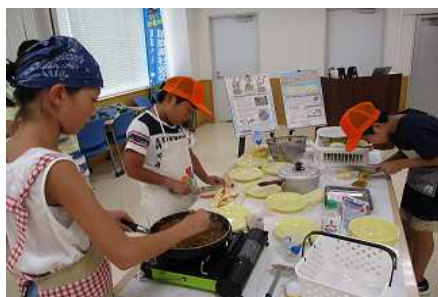
食品ロス削減啓発イベント