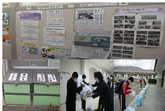
新 学校版環境 I S O の活動の様子

さらには、学校と地域が一体となり、河川の水質調査、清掃などに取り組み、環境保全活動の一役を担っているところもあります。そのほか、県民や事業者の自主的な活動の支援として環境アドバイザーの派遣に取り組みました。