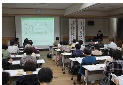
食品ロス削減セミナー

さらに令和元年度には、「食品ロス削減全国大会」を本県で開催し、家庭や飲食店等における食品ロス削減の気運を醸成し、県民運動へと展開しました。