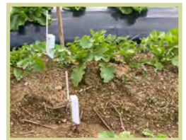
白い機械が水分センサーデータはクラウド上に自動で送信される

AI の活用方法や最先端のロボットについて学ぶとともに、ディスカッション等を通して、新しいアイデアを創出する方法を体験しました。最先端技術を身近に感じることができました。