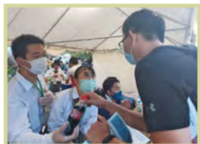
北島ひょうたん夏祭りの様子

県内唯一の国際英語科を有する徳島北高校では国際交流を通して、地域課題の解決に取り組んでいます。