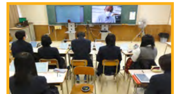
遠隔授業の様子 (海部高校)

遠隔・オンライン教育は、授業支援アプリケーションの情報共有機能を効果的に使用すれば、対話的・協働的な学習においても効果があります。時間的・空間的な制約を超える、双方向性など、ICT のメリットを最大限に活用し、 個別最適な学びと協働的な学びの一体的な充実 を図りましょう。