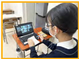
日韓高校生交流プログラム (城ノ内中等教育学校)

授業改善をはじめ、地域や大学等との連携による探究活動の推進など、 学びの可能性を広げる ツールとして更なる活用を図り、豊かな学びを創出しましょう。