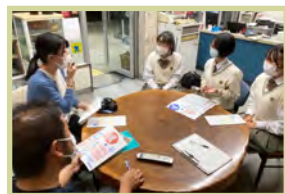
地元商工会との打合せ

地域の祭りに言語スタッフとして参加しました。アメリカ、台湾、ベトナムなど、様々な国の出身者が来てくださいました。訪れた外国の方を私たち高校生が案内し、日本の祭り文化を体験してもらいました。日本の高校生や、地域の人々と話す機会を持つことができ良かったなど、好意的な感想を頂きました。