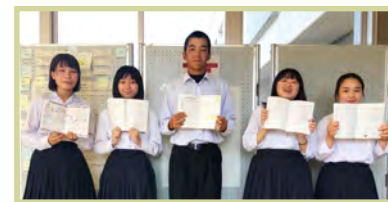
模範となる使い方をしている生徒を表彰する「手帳コンクール」

キャリア・パスポートとして部活動の記録やボランティアの記録、資格取得の記録を記入しています。各学期や定期考査の振り返りに活用したり、各種行事や講演会などがあつた際にも、この手帳にメモを取ったりしています。また、ホームルーム担任とのコミュニケーションツールとしても活用しています。