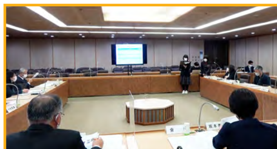
第3回徳島県公立高等学校魅力化推進委員会での那賀高校の発表の様子（令和4年11月29日開催）