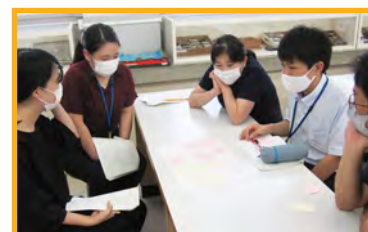
ワークショップ形式の検討会の様子(城北高校)

徳島県教育振興計画が改定される令和5年度は見直しを図る絶好のタイミングとなります。学校教育活動の新たな指針として、中学生や保護者の主体的な進路選択に資するよう、積極的な情報発信に努めましょ。