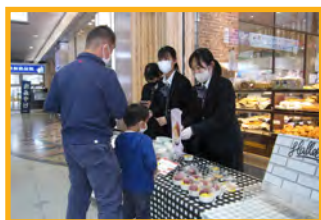
地元企業と連携して開発した商品の販売活動(城北高校)

地域にある人的・物的資源を効果的に活用した学習活動により、幅広い人たちとの世代を超えた交流を促進し、地方創生を担う実践力を育成ましょ。