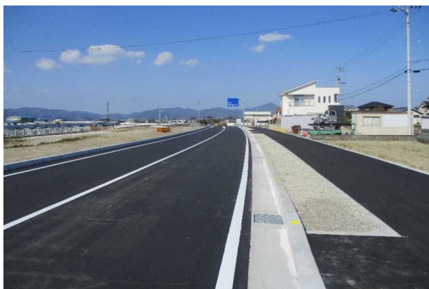
整備後 (主)徳島環状線 国府～藍住工区