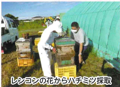
レシヨンの花からハチミツ採取