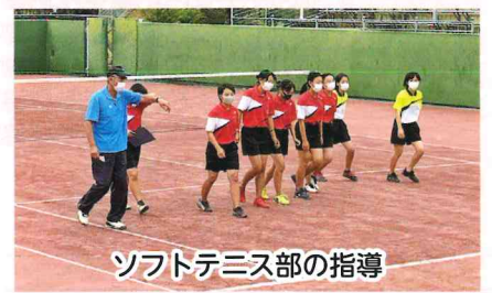
ソフトテニス部の指導