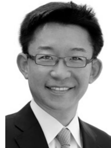
自由民主党 総務副大臣