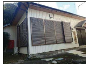
宮内西集会所 （避難所）