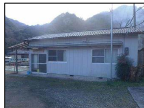
宮内東集会所 （避難所）