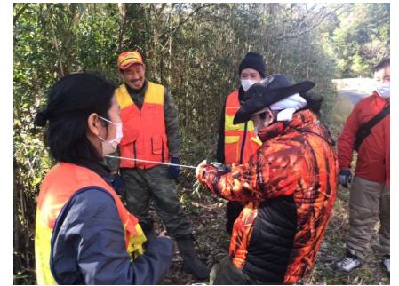
とくしまハンティングスクール