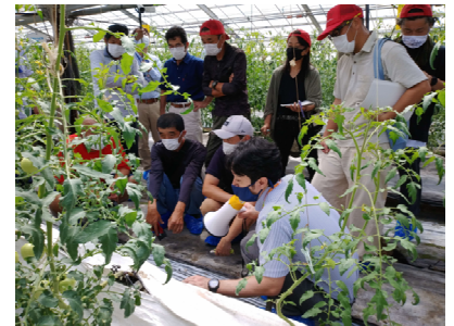
施設園芸アカデミー