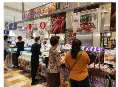
令和3年11月5日～15日 シンガポール「ジャパンフェア」