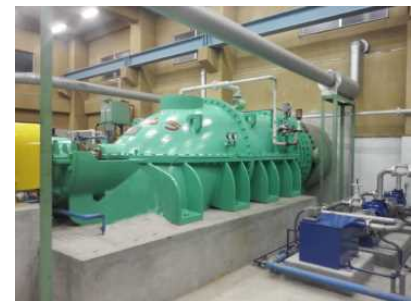
ホールホールされた排水ポンプ(堀江排水機場)