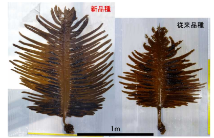
高水温耐性ワカメ品種