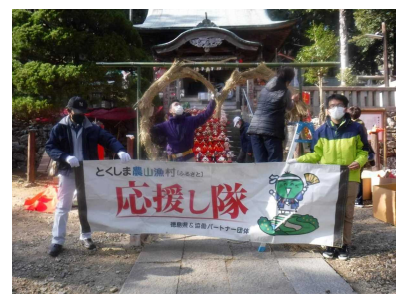
とくしま農山漁村(ふるさと)応援し隊