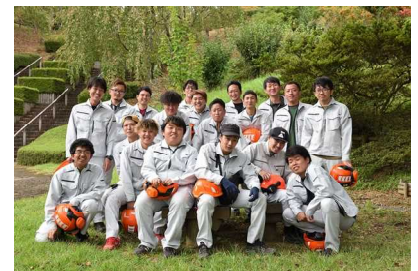
とくしま林業アカデミー