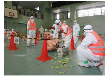
家畜伝染病防疫研修(豚熱)