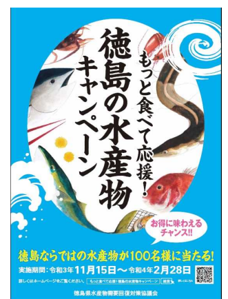
もっと食べて応援！ 徳島の水産物キャンペーン