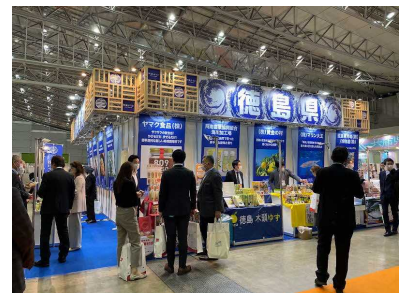
令和4年2月幕張メッセでの展示商談会