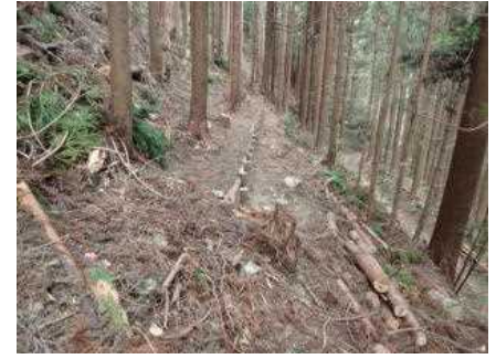
森林整備（本数調整伐）