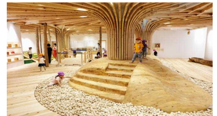
徳島木のおもちゃ美術館