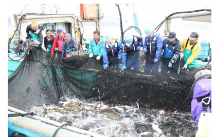
とくしま漁業アカデミー