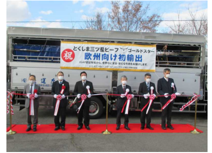
とくしま三ツ星ビーフ欧州初輸出出発式