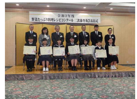
野菜たっぷり料理 レシピコンクール