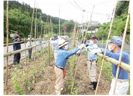
県民参加型の森づくり活動