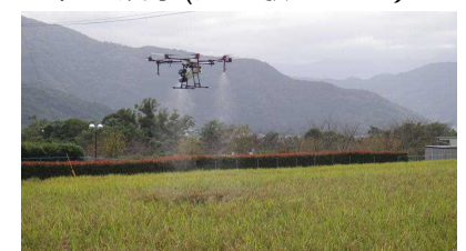
農薬散布ドローン