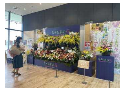
フラワーフェスティバル 花き展示(道の駅いたの)