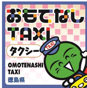
おもてなしタクシー