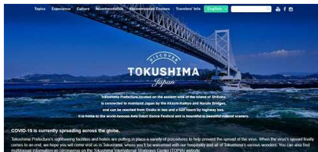
徳島県多言語観光情報ウェブサイト 「Discover Tokushima」