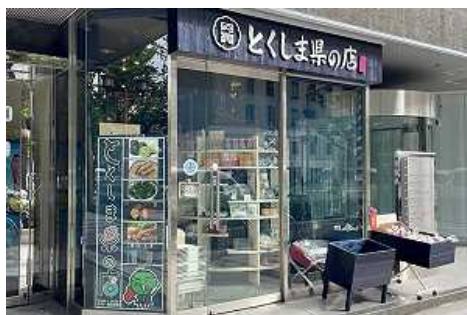
大阪「とくしま県の店」