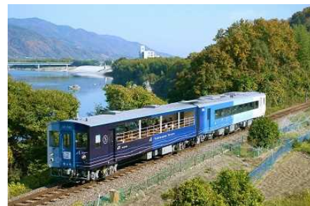
藍よしのがわトロッコ

「藍よしのがわトロッコ」令和3年度 乗車実績 合計5,374名（定員8,176名）、乗車率65.7% ※令和3年4～5月、8～12月、令和4年3月運行