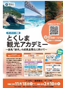
とくしま観光アカデミー