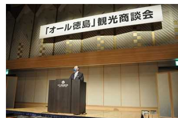
「オール徳島」観光商談会