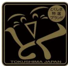
とくしま特選ブランド