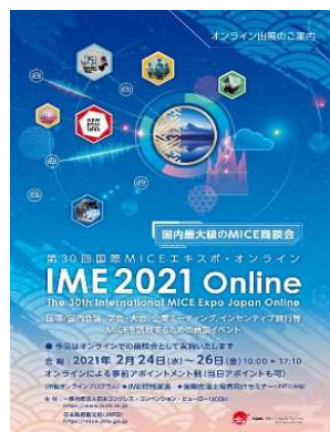
国際MICEエキスポ（東京/オンライン）