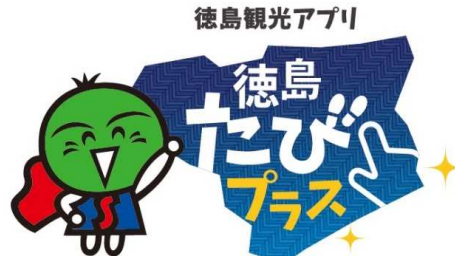
徳島県マスコット「すだちくん」