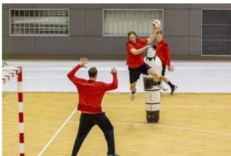
ドイツ代表チーム事前キャンプ受入