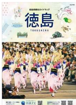
徳島県観光ガイドマップ