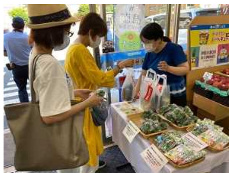
札幌アンテナショップ