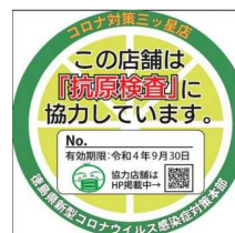
コロナ対策三ツ星店ステッカー