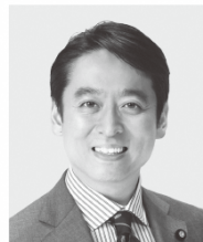
平木 だいさく 現 役職：元経済産業大臣政務官、 参院議員1期。 経歴：東京大学法学部卒。 年齢：44歳 未来をひらく 確かな実力!