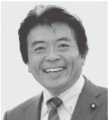
弁護士 仁比 そうへい 現 55歳。参院議員2期。党参院国対副委員長。 活動地域 中国、四国、九州・沖縄