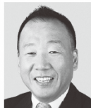
おおしま くすお 大島 九州男 参議院議員 現職 平和憲法の精神を守ります