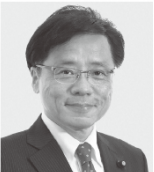
党参院幹事長・国対委員長 井上 さとし 現 61歳。参院議員3期。 活動地域 東海、北陸信越、京都