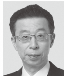
はまの よしふみ 浜野 よしふみ 参議院議員 現職 まっすぐに力強く！働く仲間のために！