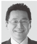
いそざき 哲史 いそざき 哲史 参議院議員 現職 仲間思い、かたちにしたい。