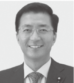
党副委員長 山下 よしき 現 59歳。参院議員3期。 活動地域 大阪、兵庫、滋賀、奈良、和歌山