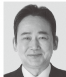
いしがみ としお 石上 としお 参議院議員 現職 全力で暮く。全力で届ける。全力で挑む。