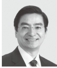
山本 ひろし 現 役職：元財務大臣政務官、 参院議員2期。 経歴：慶應義塾大学法学部卒。 年齢：64歳 現場直結で障がい者支援と 地域復興