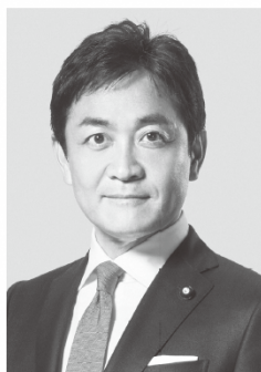
国民民主党 代表 玉木雄一郎