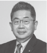
党書記局長 小池 晃 現 59歳。参院議員3期。全国革新懇代表世話人、医師。 活動地域 東京