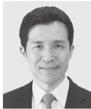
新妻 ひでき 現 役職：元文部科学大臣政務官、 参院議員1期。 経歴：東京大学大学院修士課程修了。 年齢：48歳 「ものづくり」でこの国を元気に!