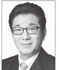
代表 松井 一郎