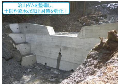
【治山ダム 藤原地区 (美馬市)】