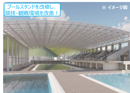
【蔵本公園 むつみスイミング (徳島市)】