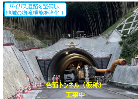
【由岐大西線 色面～北棚田工区 (阿南市)】