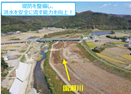
【吉野川水系 園瀬川 (徳島市)】

気候変動の影響による災害の激甚化・頻発化に対応するため、 あらゆる関係者が協働して「流域治水」を推進