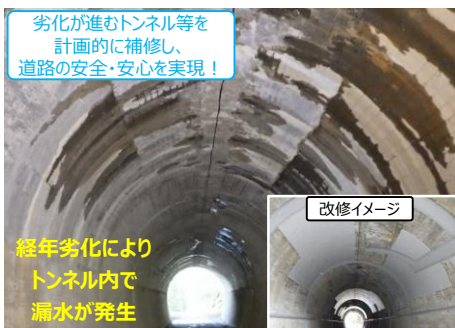
【国道193号 海川トンネル (那賀町)】

早期に対策が必要なインフラ施設の修繕等を集中的に実施し、 予防保全型の「インフラ老朽化対策」へ転換