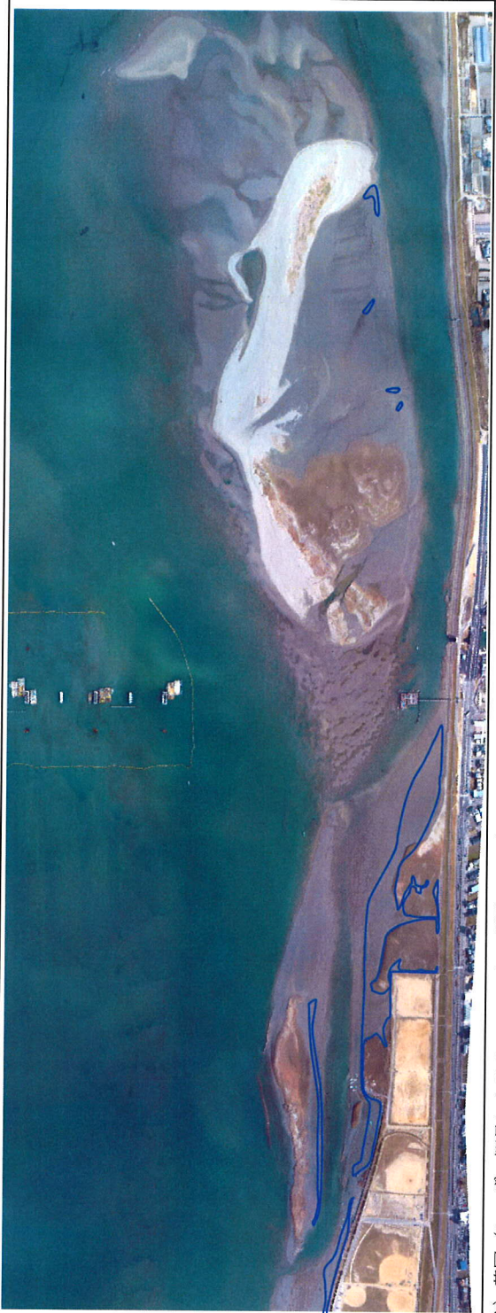
注) 基図(レーザー測量によるオルソフォト) 撮影日:平成17年3月14日