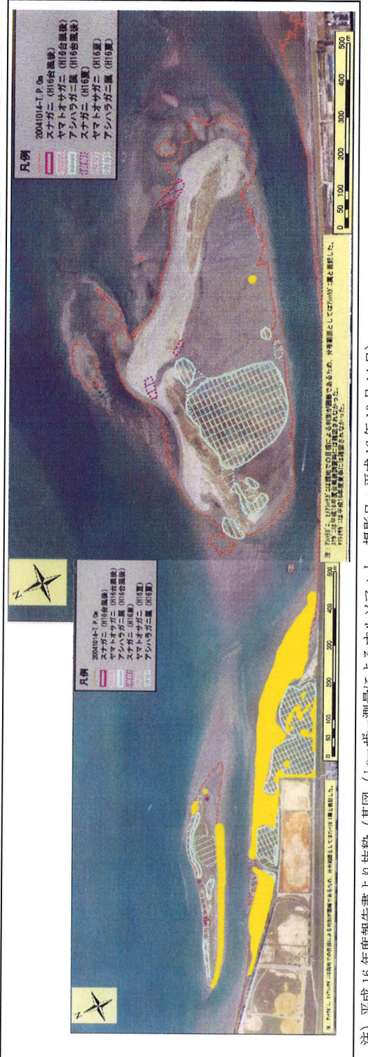
注) 平成16年度報告書より抜粋 (基図 (レーザー測量によるオルソフォト 撮影日: 平成16年10月14日))