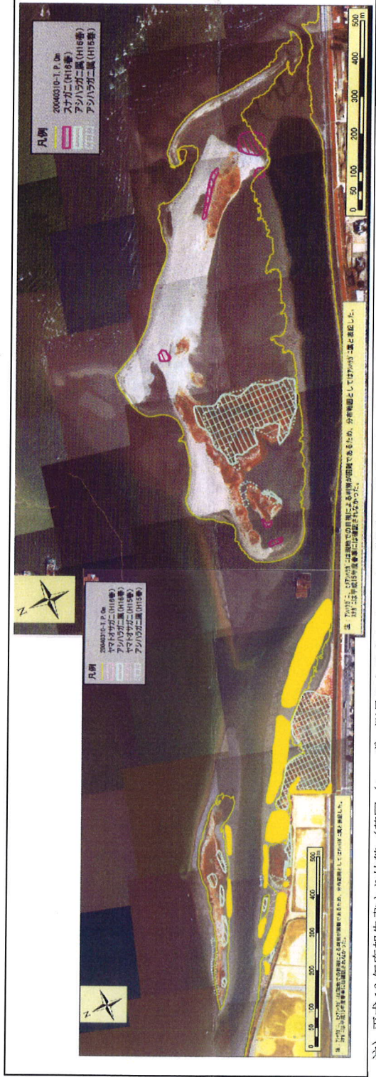
注) 平成16年度報告書より抜粋 (基図 (レーザー測量によるオルソフォト 撮影日: 平成16年3月10日))