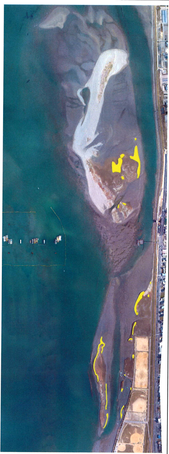
注) 基図 (レーザー測量によるオルソフォト) 撮影日: 平成 17 年 3 月 14 日