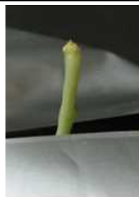
展葉なし（芯止まり） =4