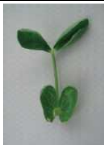
カップ状からさらに変形 =2