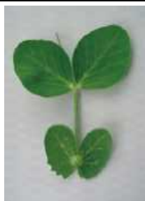
わずかにカップ状 =0.5