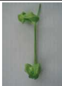
ひどく変形し原型をとどめない =3