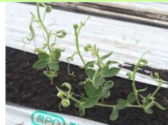
品目：スイートピー 症状：葉の異常