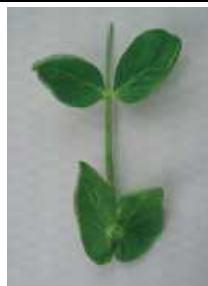
明らかにカップ状 =1