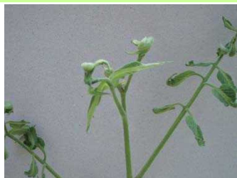
品目：トマト 症状：葉の異常