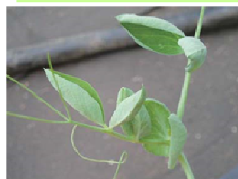
品目：さやえんどう 症状：葉がカップ状になる