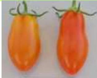
品目：ミニトマト 症状：果実が細長く変形