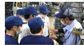
企業見学バスツアー