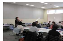
資格・スキル取得促進 (図書館サポーター養成講座)