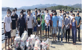
地域と連携したビーチクリーン活動