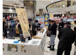
徳島の特産「ゆこう」商品の販売 (小松島西×小松島西勝浦)