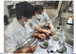
徳島大学との「イシマササユリ」共同研究