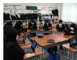
コロナ禍での海外とのオンライン交流