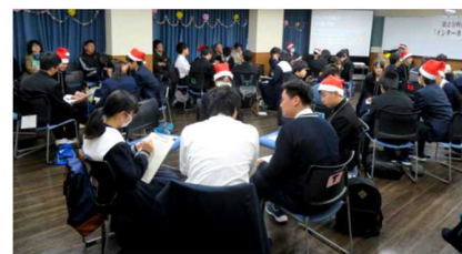
「協力」「参加」「体験」を交えた教育活動の推進