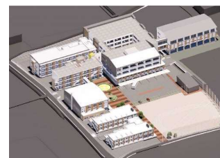
国府支援学校整備イメージ図