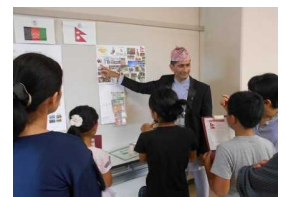
小学生と留学生との交流