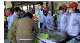
起業体験活動の様子 (横瀬小)