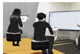
VRでのアバターによる授業イメージ