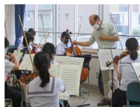
部活動指導員による指導