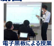
電子黒板による授業