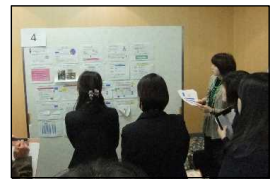
実践研究報告会の様子 (ポスター発表)