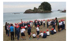
徳島の自然を体験