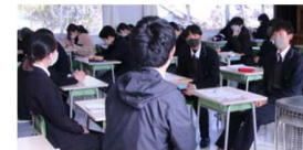
大学生による キャリアガイダンス