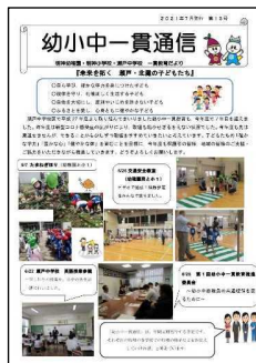
鳴門市での取組広報誌(明神小、瀬戸中)