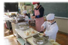
冬野菜の米粉シチュー