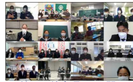
第1回徳島県いじめ問題 子どもサミット