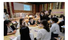
若者の地域課題解決力向上 (多世代参加型社会教育ワークショップ)