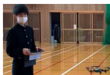
ドローンを使った学習(佐那河内中学校)