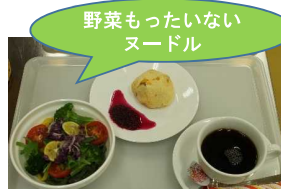
食品ロス削減メニューの考案