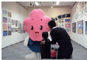
「きらめきアート展」