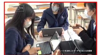
端末を活用した授業の様子