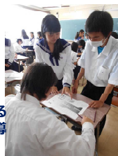
名西高校生による 中学生への技術指導