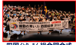
四国インターハイ 総合開会式

全国から3700名の選手・役員を四国に迎え 3年ぶりに有観客で開催 51年ぶりとなる本県での総合開会式は 動画再生回数が2日間で約2万回