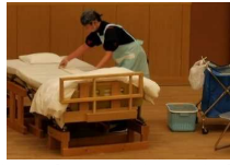
とくしま特別支援学校技能検定 (介護)