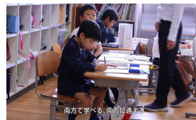
一緒に授業を受ける子ども