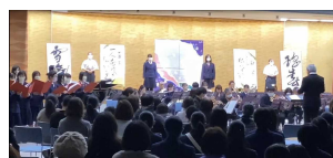
名西高校フェスティバル