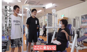
海陽町のPR動画制作