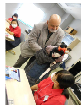
阿波人形浄瑠璃体験