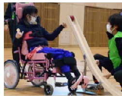
第1回特別支援学校ボッチャ大会開催