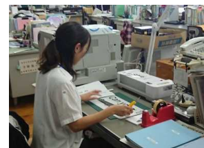
事務作業等の支援を行う 教員業務支援員 (スクール・サポート・スタッフ)