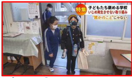
「ポジティブな行動支援」の取組 (北海道放送での特集報道)