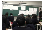
「政策提言書」 作成の取組 (鳴門高校、 鳴門渦潮高校)