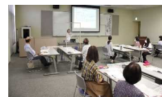
「社会教育人材」の養成 (がんばるあなたのスキルアップ講座)