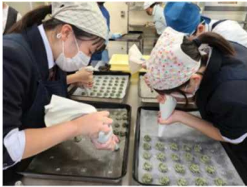
「阿波藍」クッキーの製造 (城西×科技×徳商)