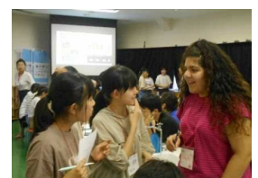
高校生の英語漬けキャンプ