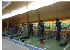
城西高校ライフル射撃部