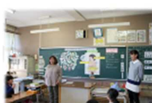
栄養教諭による食育授業