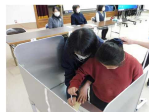
支援学校における 選挙に関する基礎知識、投票体験