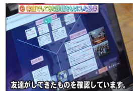
端末での課題共有