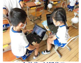
主体的・対話的で深い学びの実践