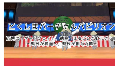
徳島県が万博に向けてオープンした とくしまバーチャルパビリオン