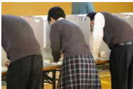
高校生による 模擬投票 (那賀高校)