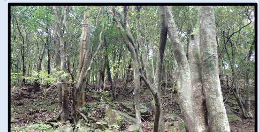
とくしま県版保安林指定地 (阿南市大田井町松ノ岡)