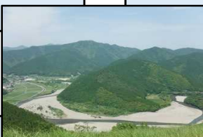
徳島が「リーンスタイル」の展開