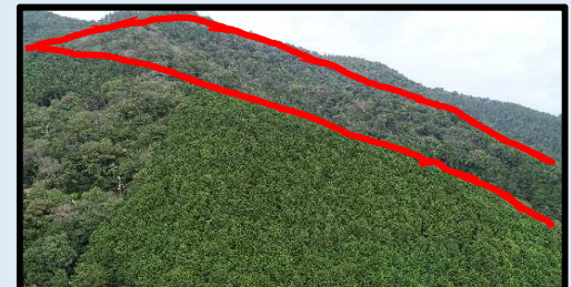
とくしま県版保安林指定地 (阿南市大田井町松ノ岡)