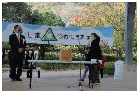
木球プール抽選会