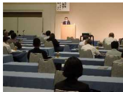
R 3 総会