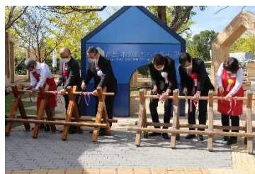
オープニング式典