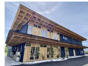
民間での利用促進