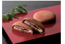
プレミアム金長まんじゅう