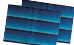
阿波しじら織り 風呂敷さ