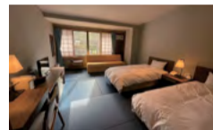
神山温泉 ホテル四季の里&いやしの湯 宿泊割引券