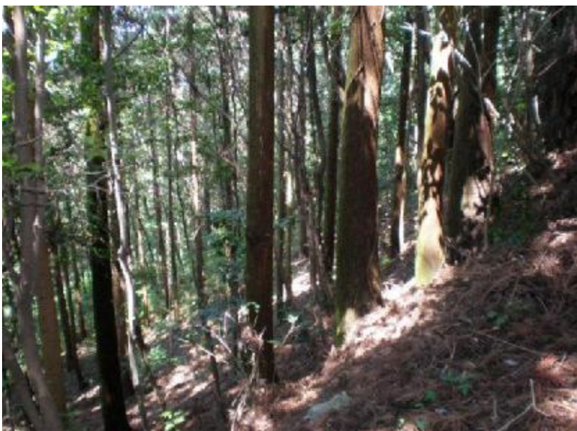
林内状況(私有林 間伐計画地)