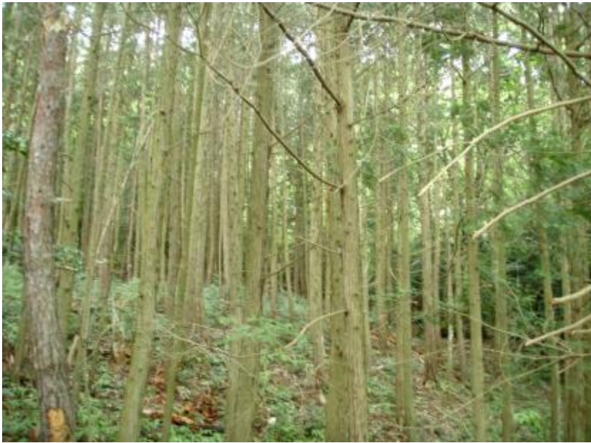
林内状況(間伐計画地)