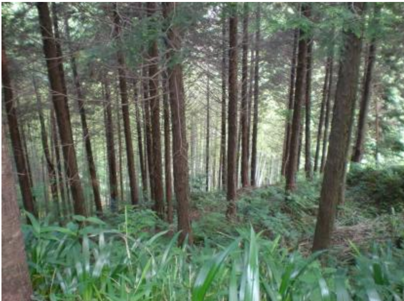
林内状況(間伐計画地)