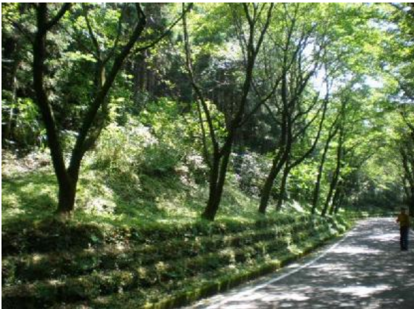
町道大地の森線沿線(私有林)