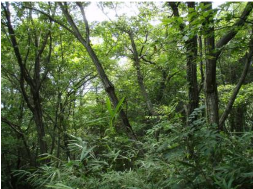
林内状況(広葉樹整理計画地)