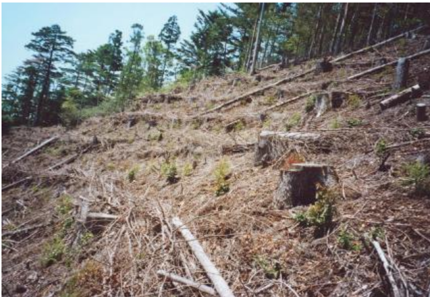
施行地状況(植栽計画地)