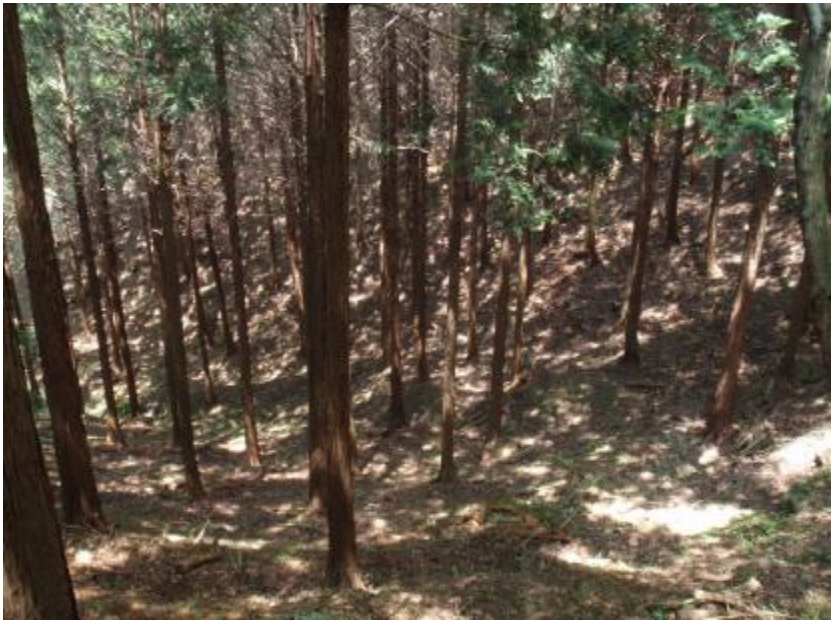
林内状況(町有林 間伐計画地)