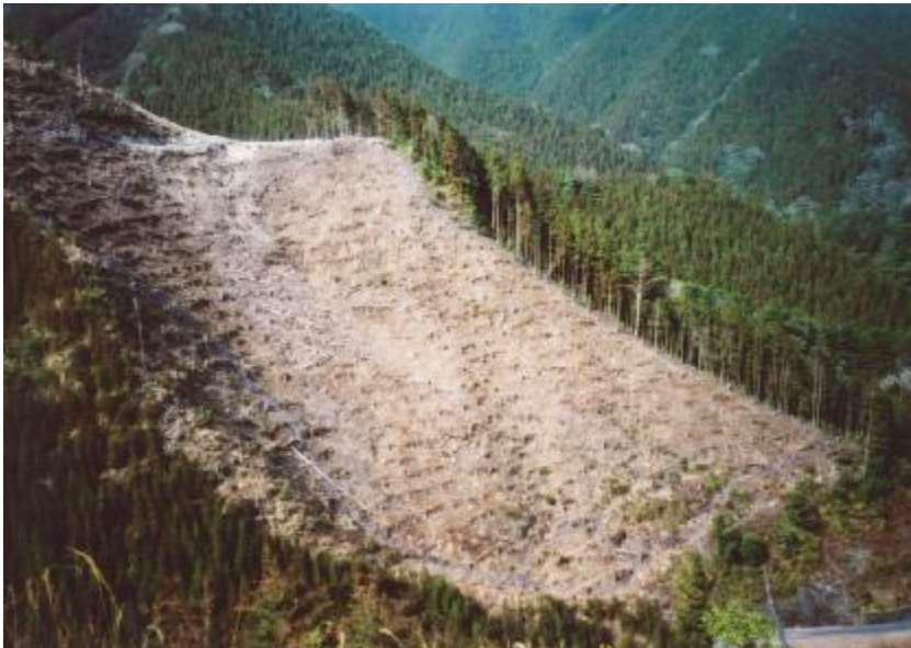
施行地状況(植栽計画地)