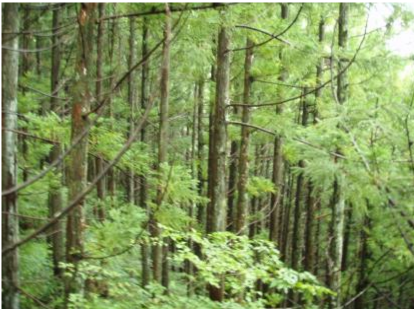
林内状況(間伐計画地)