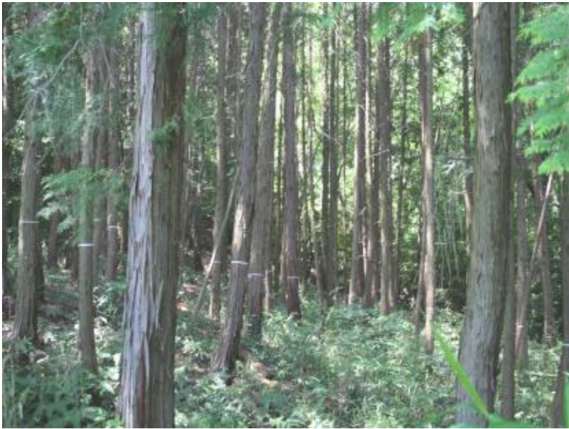
林内状況(間伐計画地)