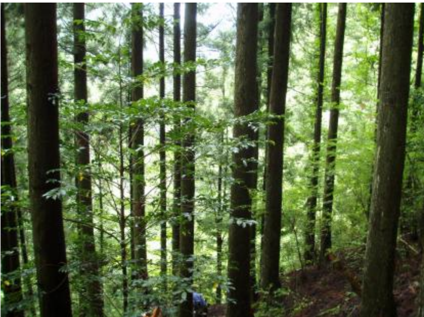
林内状況(間伐計画地)