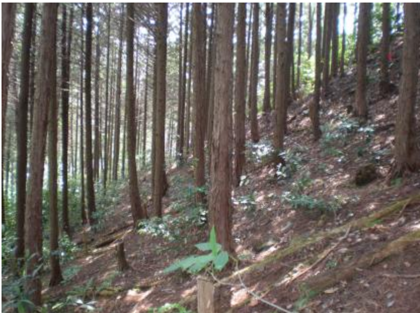
林内状況(間伐計画地)