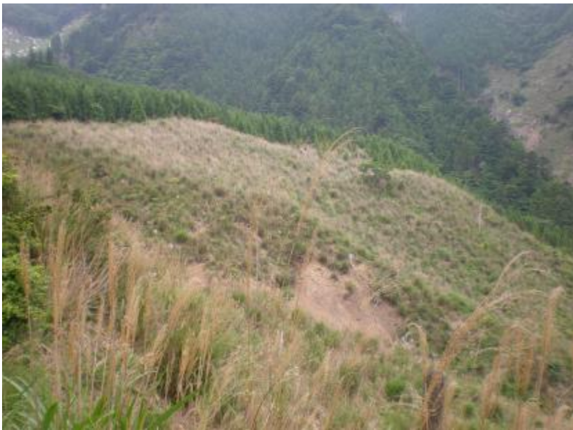
施行地状況(植栽計画地)