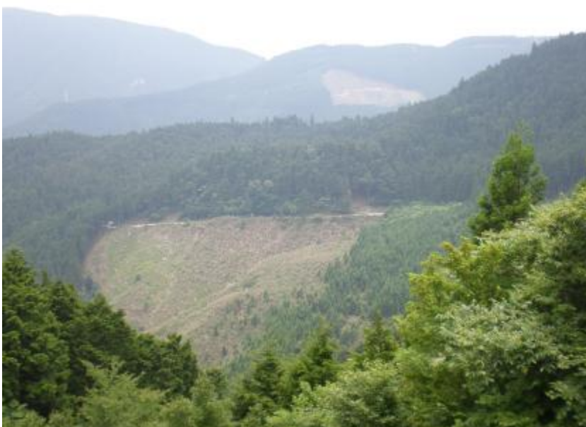
施行地遠景(千年の森広場より)