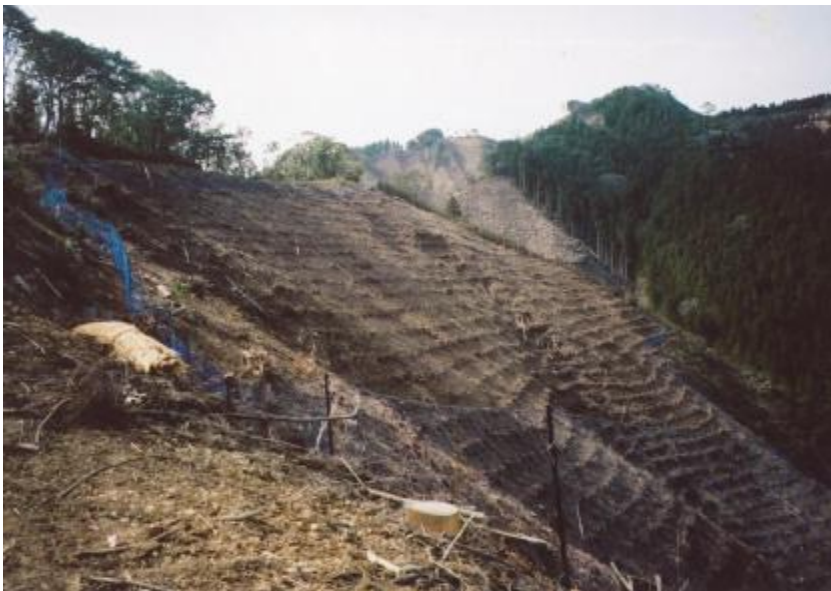
施行地状況(植栽計画地)