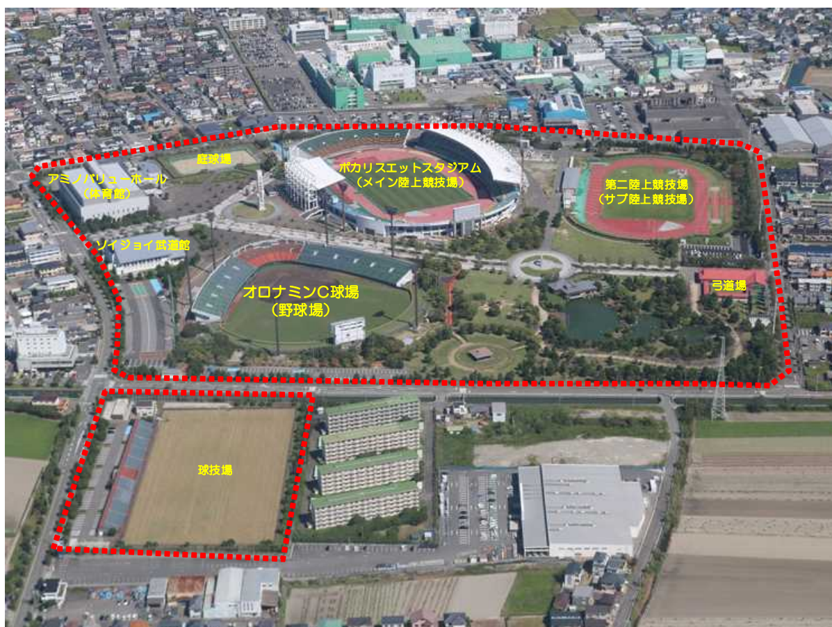
図 1 本公園における施設配置図