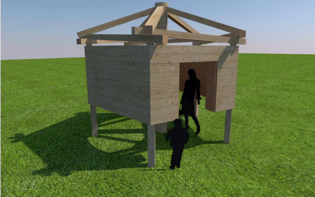
提案③「徳島すぎギャラリー」