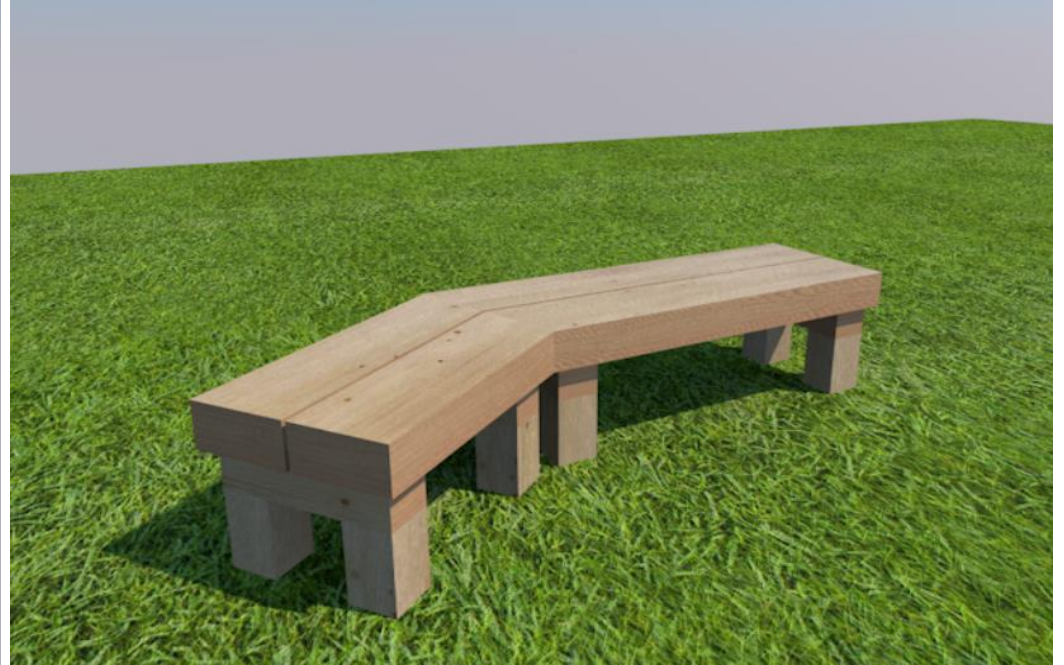
提案②「アングル36」ベンチ