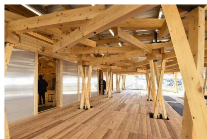
選手村ビレッジプラザ

今回、本県における「レガシー木材」の再利用について、 ・提案① 「鳴門・大塚スポーツパーク」の内装木質化 ・提案② 様々な施設で利用可能な木製ベンチの製作 ・提案③ 自由提案による木製品の製作 の3つのテーマで、公募を実施し、次のとおり、事業者と活用方法を決定した。