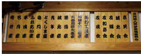
客席の壁には太夫・人形座の木札が並びます。