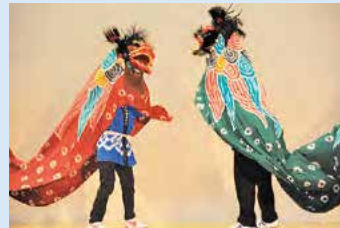
吉野中学校郷土芸能部の獅子舞

●皆さんからのご意見・ご感想をお待ちしています。 学校教育課 ☎088-621-3054 FAX088-621-2882