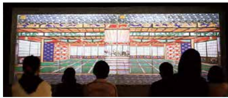
デジタル襖からくり