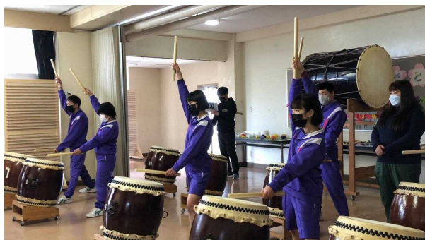
(国府支援学校 和太鼓練習風景)