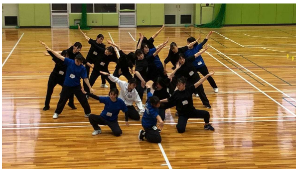
(ダンス 合同練習会風景)