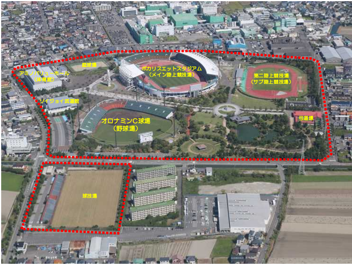
図1 本公園における施設配置図