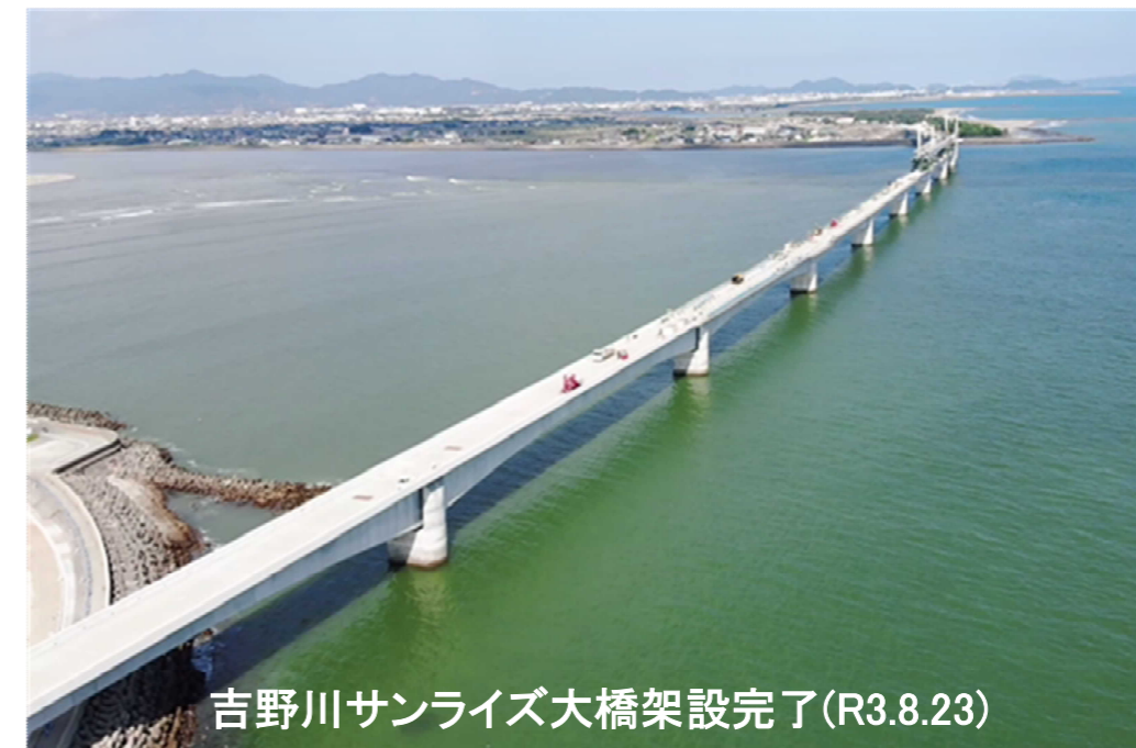
吉野川サンライズ大橋架設完了(R3.8.23)