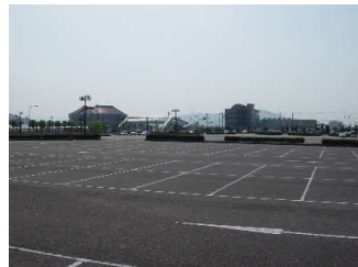
イベントスペース