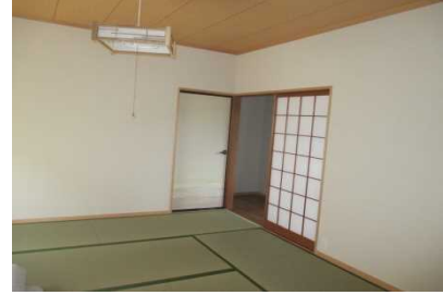
完成 内部壁ビニールクロス貼

無筋コンクリート基礎に鉄筋コンクリートべた基礎を施工、掃出し開口部に耐力壁を新設することにより、耐震性を評点1.0以上(一応倒壊しないレベル)に改善。また塗り壁の和室を大壁としビニールクロス仕上げにすることによりメンテナンスし易くし、床下に断熱材を入れ住環境を良くした。