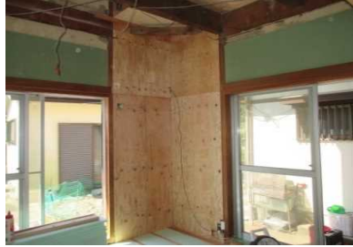
工事中 構造用合板施工