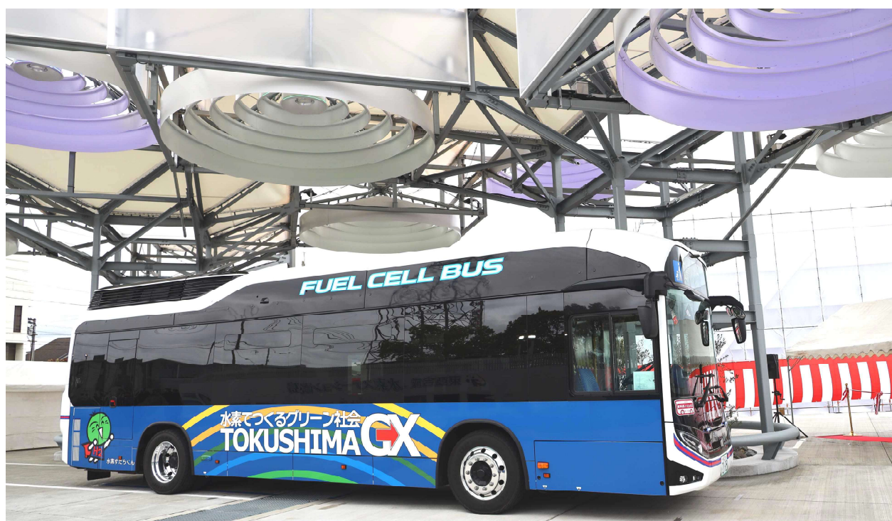
全国初！「地産水素」活用の「製造・供給一体型」水素ステーション 開所