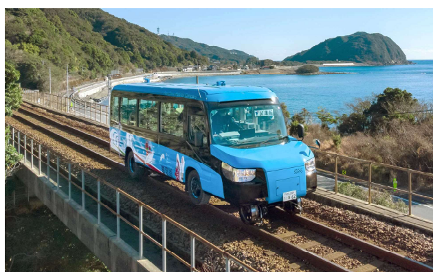
世界初の本格営業運行！線路と道路を走る「DMV」