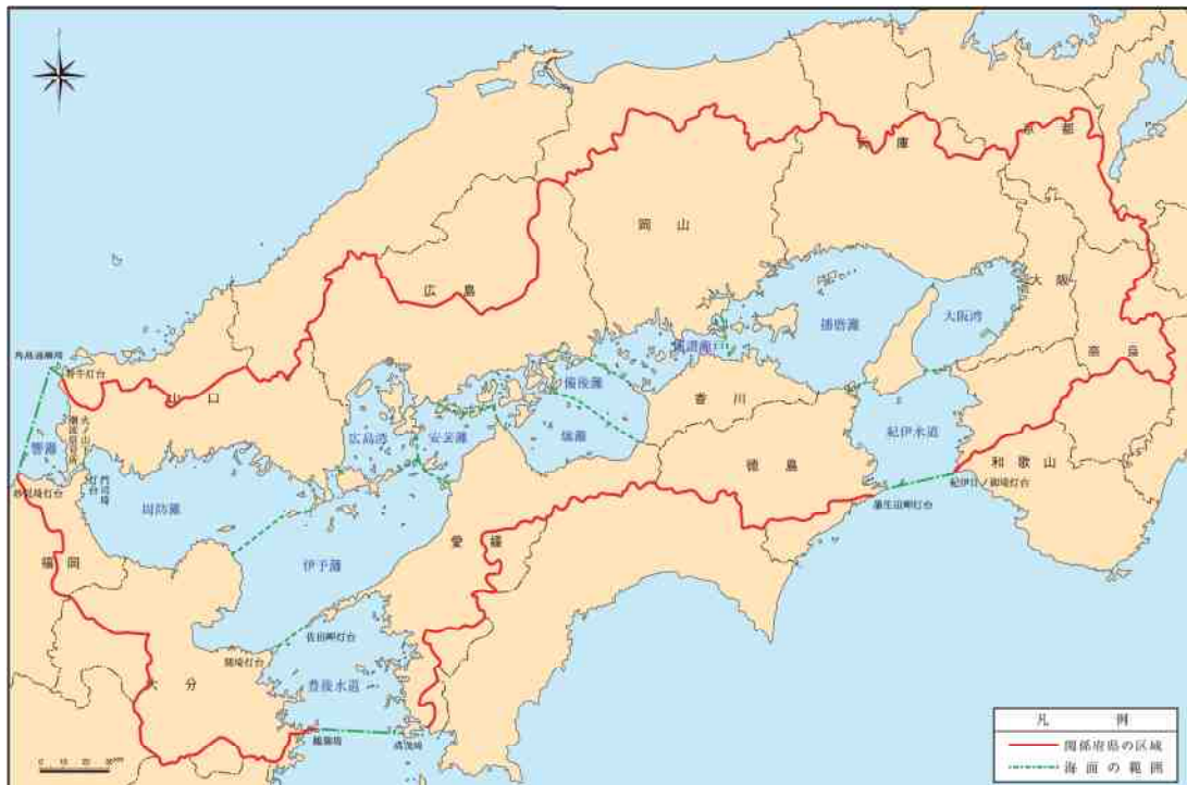
瀬戸内海環境保全特別措置法による対象区域

この計画は，「瀬戸内海の環境保全に関する徳島県計画」との一体的な取組により，里海の再生・創生を推進するものである。