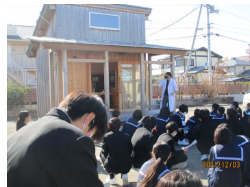
ゼロエネルギーハウス