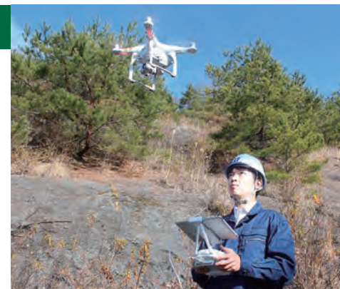
▼ ドローンによる調査