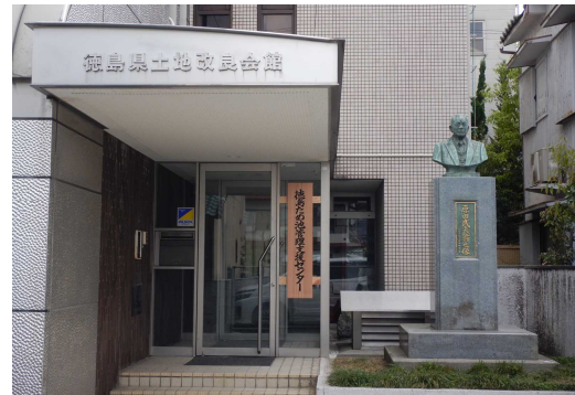
徳島ため池管理支援センター (徳島県土地改良会館内)