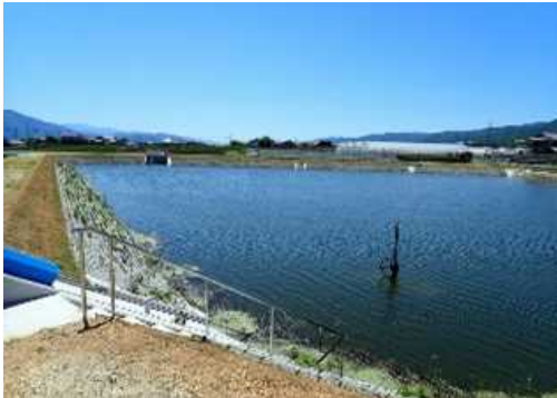
源太池(阿波市市場町)