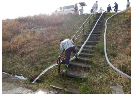
天神池(美馬市脇町)での緊急放流訓練