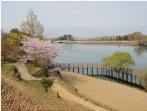
大正池(吉野川市川島町)