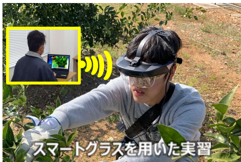
スマートグラスを用いた実習