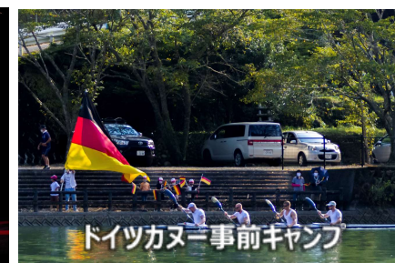
ドイツカヌー事前キャンプ