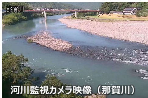
河川監視カメラ映像（那賀川）