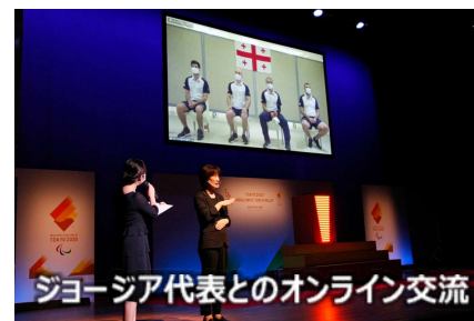
ジョージア代表とのオンライン交流