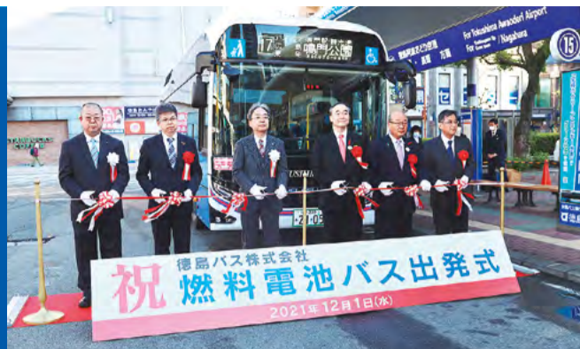
水素グリッド構想の加速