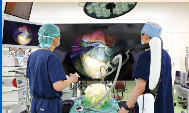
5Gと8Kを活用した最先端医療技術の提供