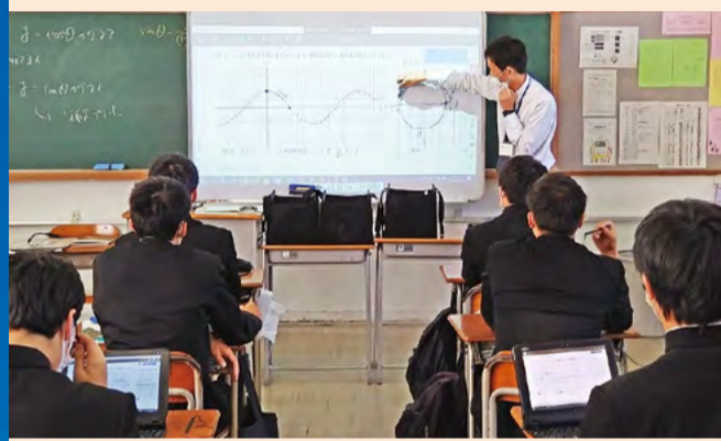
デジタル技術を活用した学びの充実