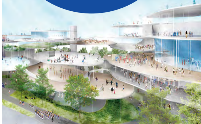
徳島文化芸術ホール(仮称)の設計