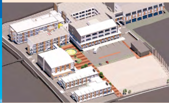
国府支援学校「新校舎棟」の整備着手