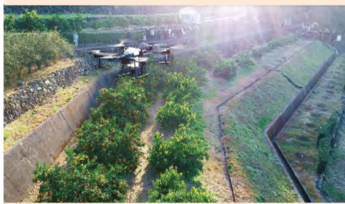
スマート農林水産業の加速