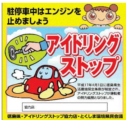
アイドリングストップ協力店啓発ステッカー

本県では、県内の酸性雨測定監視を継続するとともに、国の調査などから酸性雨による環境影響に関する情報収集を行っています。また、酸性雨の原因物質であるいおう酸化物、窒素酸化物の発生抑制のため、工場・事業場への規制を実施したほか、アイドリングストップ等の自動車の燃料消費量の削減に向けた啓発等に取り組んでいます。