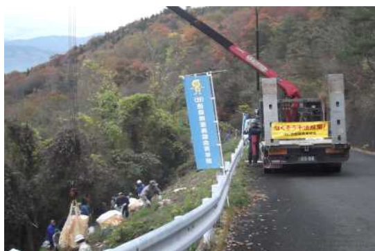
とくしまエコサポート事業

国、市町村、警察といった関係機関と連携し、不法投棄や違法な不用品回収など、不適正処理の防止に努めるとともに、企業や団体・地域住民等との連携による不法投棄監視体制を充実させました。