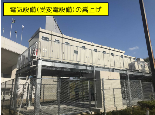
電気設備(受変電設備)の高上げ