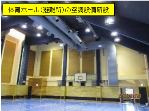
体育ホール(避難所)の空調設備新設