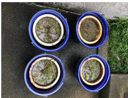
生育状況 (R3. 8. 18)

ミズタカモジグサの個体の育成、維持管理を行い、生育状況のモニタリングを行った。順調に生育中であり、工事後、植え戻しを行う予定。