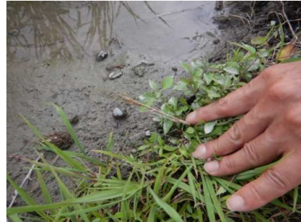
種子採取状況 (R3. 6. 25)