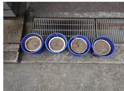
植付けした鉢を水受けバケツに入れ育成 (R3. 6. 25)

ミズタカモジグサの個体の育成、維持管理を行い、生育状況のモニタリングを行った。順調に生育中であり、工事後、植え戻しを行う予定。