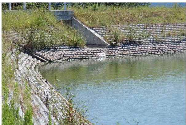
植生状況（令和3年9月）