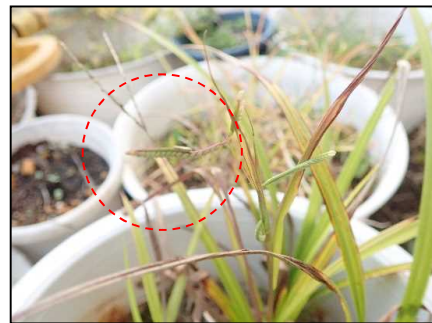
スズメノコビエの開花状況(R3.11.1)

採取したコカモメヅルとスズメノコビエを育成し、種子の採取及び播種により移植のための苗の生産を行う。