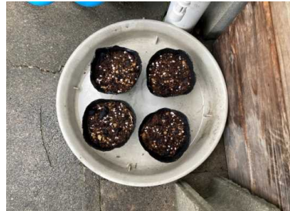
ミズタカモジグサの種子を播種し育苗 (R3. 7. 31)

ミズタカモジグサの苗の生産を行い、生育状況のモニタリングを行った。順調に生育中であり、工事後、植え戻しを行う予定。