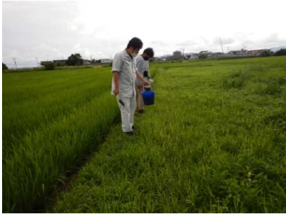
ミズタカモジグサ自生地状況 (R3. 6. 25)

今年度、工事予定期のミズタカモジグサの生育状況の確認を行い、 個体 を堀取り鉢に移植を行った。