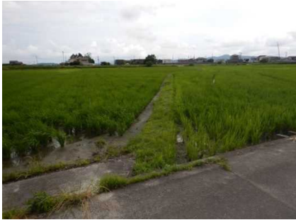
ミズタカモジグサ自生地状況 (R3. 6. 25)

令和3年度、工事予定期のミズタカモジグサの生育状況の確認を行い、種子の採取、播種を行った。