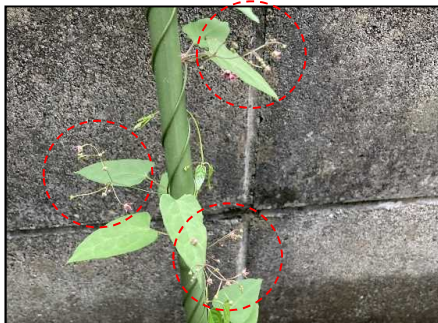
コカモメヅルの開花状況(R3.9.4)