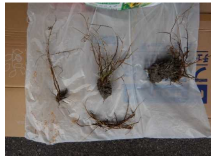
個体採取状況 (R3. 6. 25)