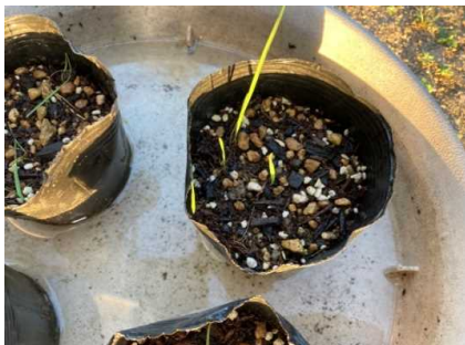
発芽の状況 (R3. 10. 3)

ミズタカモジグサの苗の生産を行い、生育状況のモニタリングを行った。順調に生育中であり、工事後、植え戻しを行う予定。