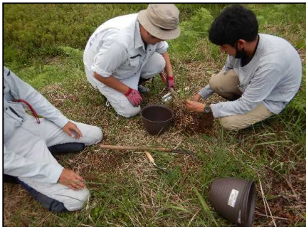
コカモメヅルの採取(R3.6.25)