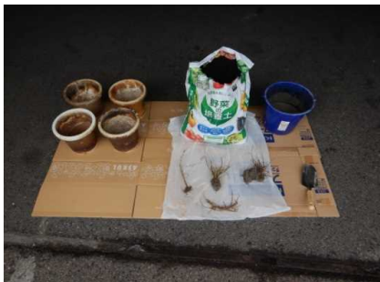
植付材料等の準備 (R3. 6. 25)