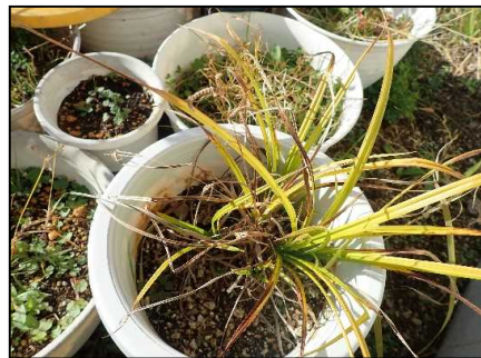
スズメノコビエ生育状況(R3.12.9)