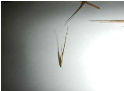
採取したミズタカモジグサ種子 (R3. 6. 25)