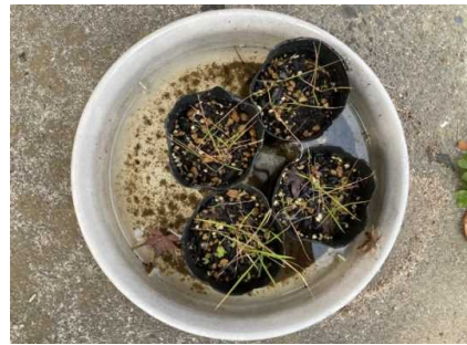
生育状況 (R3. 12. 12)