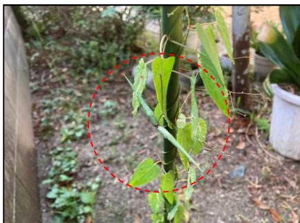
コカモメヅルの結実状況(R3.10.3)

採取したコカモメヅルとスズメノコビエを育成し、種子の採取及び播種により移植のための苗の生産を行う。