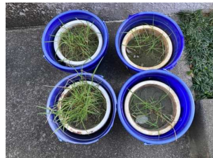
生育状況 (R3. 12. 27)