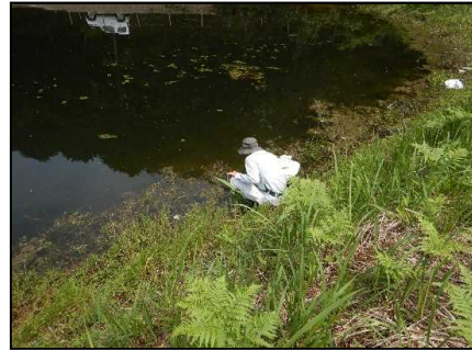
スズメノコビエの採取(R3.10.24)