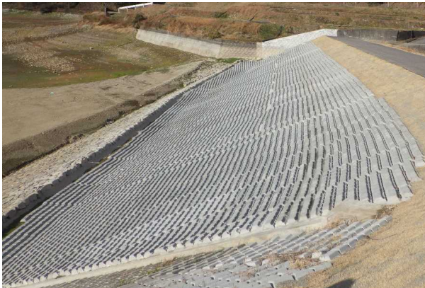
工事完成後（令和3年3月）

その結果、植物が植生し、魚介類の生息空間（産卵場所、稚魚の隠れ家等）を創出した。