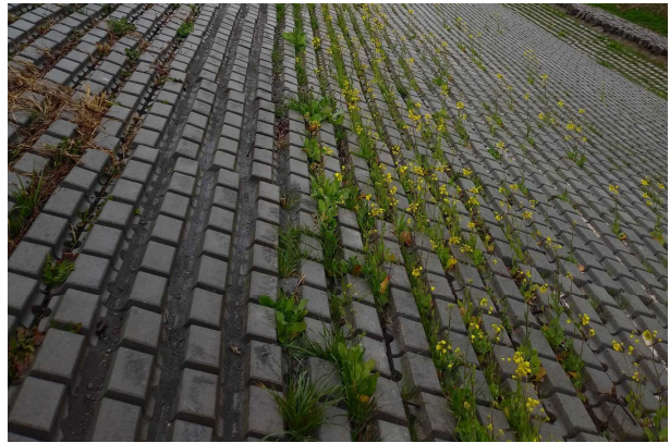
工事完成後（令和3年3月）