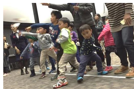
子育てイベント (JAL紙ヒコーキ教室)