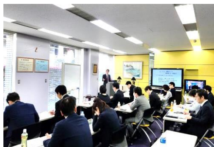
マナープロトコル研修 日経ナレッジ研修

社内に教育を担当する専門メンバーが入社時の研修は勿論、職務経験が豊富なスタッフへ向けでも日々スキルアップのための様々な教育制度を設けています。