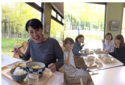
食堂 従業員の癒しと元気の源