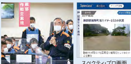
スペクティ・プロ画面

また、すだちくんメールやTwitterに加え、新たにLINEを活用した住民への「気象情報」「避難情報」等の伝達についても、年度内の本格運用を予定しています。