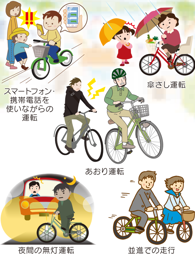
スマートフォン・ 携帯電話を 使いながらの 運転