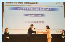
消費者志向経営優良事例表彰 R元 (株)広沢自動車学校が「大臣表彰」受賞