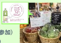
地産地消で子育て支援 (エシカル寄附付きシール) 阿波市ファミサポへ寄附