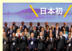
G20消費者政策国際会合