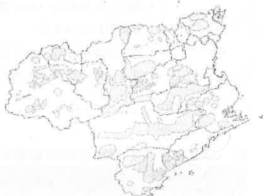
群れ推定の分布図