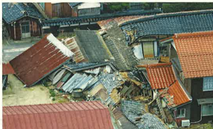
【崩壊した家屋(北栄町)】