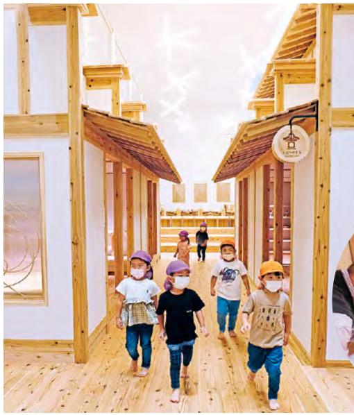
●有名な「うだつの町並み」を再現