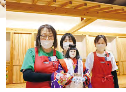
●「農村舞台」などの文化資源を再現

最初に足を踏み入れるのが、眉山や棚田、吉野川など、徳島の自然をイメージして作られた大空間。県産材の匂いや肌ざわり、温もりが包まれながら、徳島の里山風景を楽しみましょう。