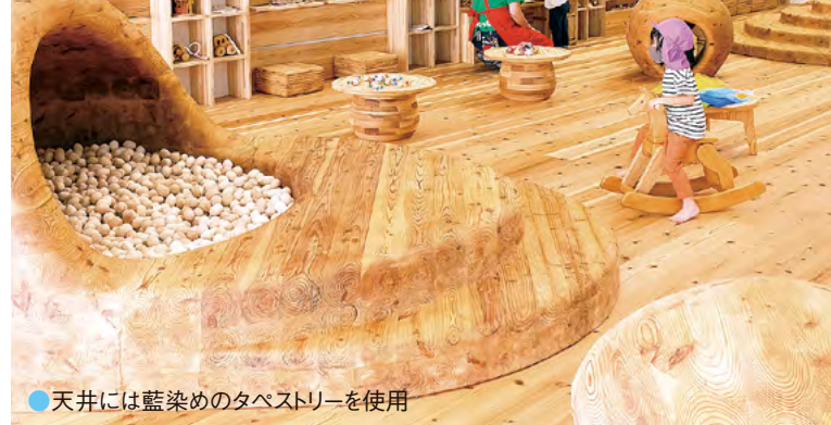
●天井には藍染めのタペストリーを使用