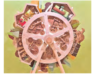
●木製からくり「山の仕事」

巨木がそびえ立つ館内の大空間では、山の散策や野菜の収穫体験などの「ごっこ遊び」を楽しむことができます。木の伐採から利用されるまでを表現した「からくり」も必見です。