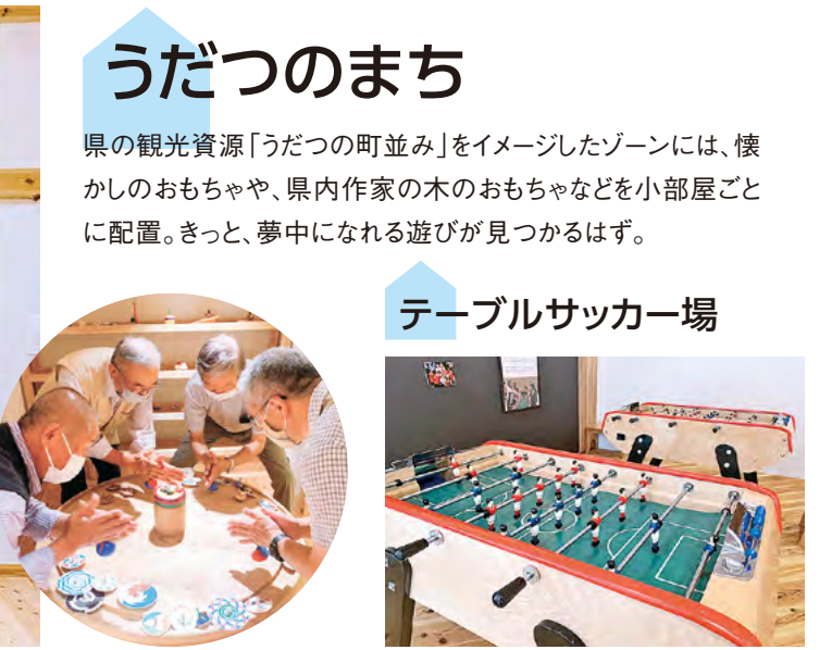
●大人も夢中になるおもちゃがいっぱい ●世界中で人気のテーブルサッカー