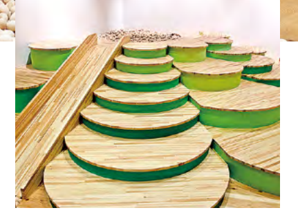
●県産材で表現した「檜原の棚田」