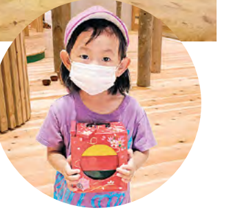
●大小さまざまな「遊山箱」も用意