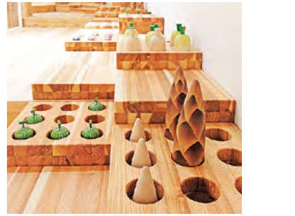
●木の野菜の収穫体験も楽しめる