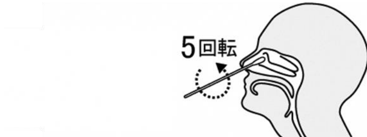
鼻腔ぬぐい液採取