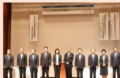
とくしま消費者志向経営推進組織設立(平成29年10月13日)