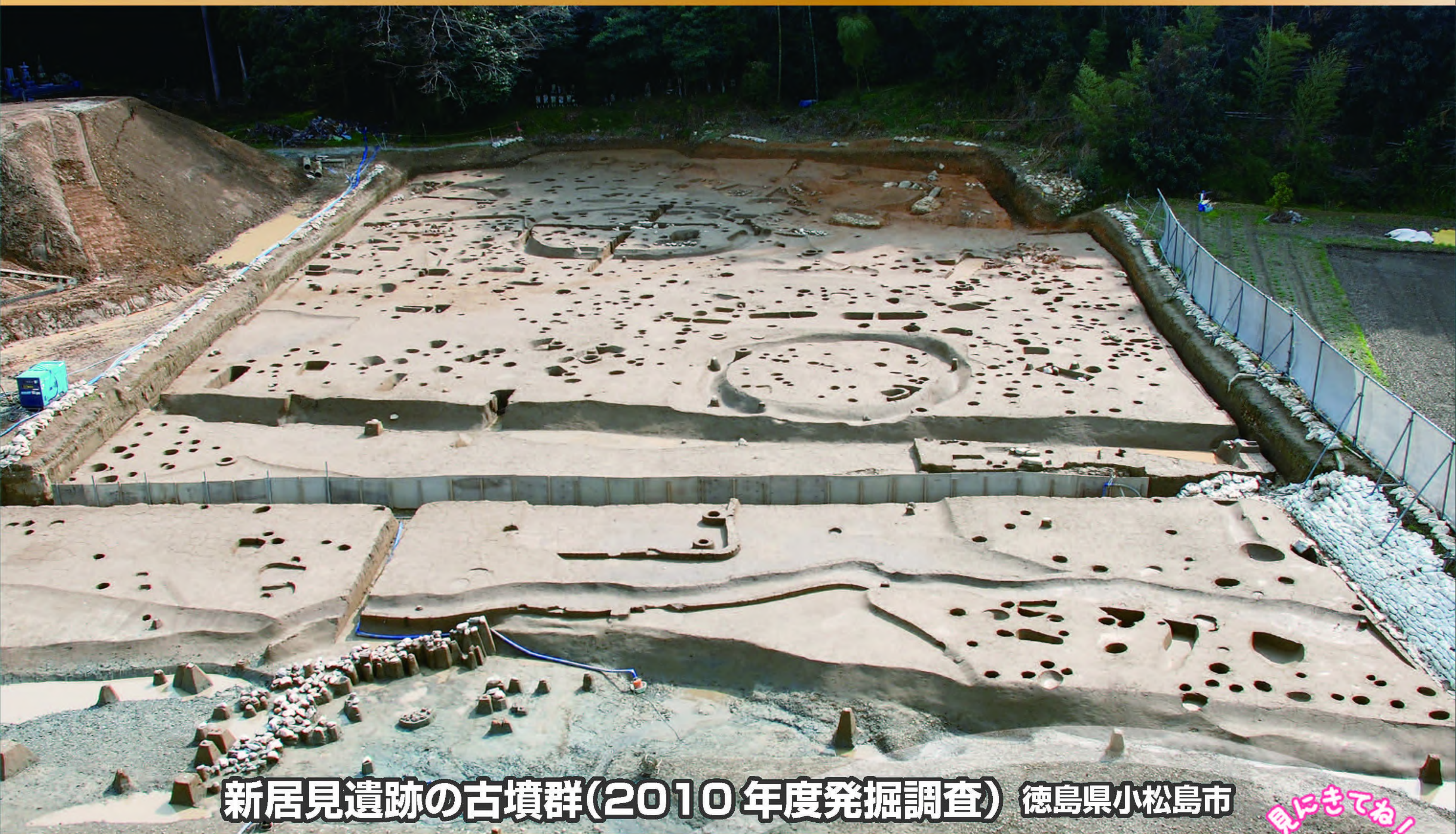
新居見遺跡の古墳群(2010年度発掘調査) 徳島県小松島市