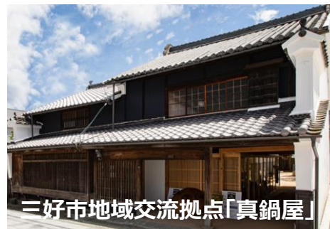
三好市地域交流拠点「真鍋屋」