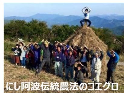
にし阿波伝統農法のコエグロ