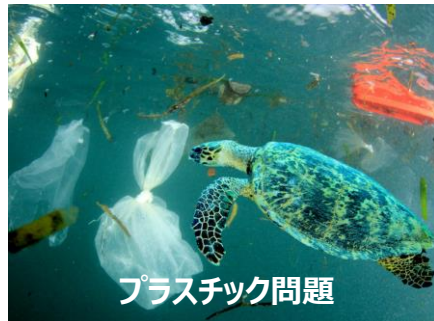
プラスチック問題