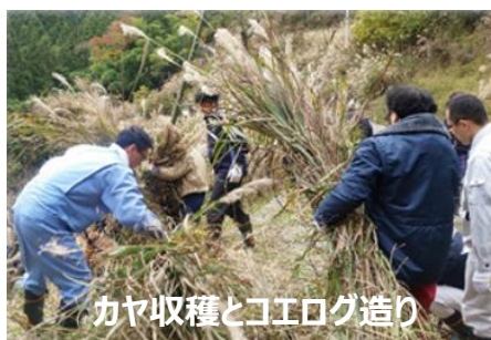
カヤ収穫とコエグロ作り