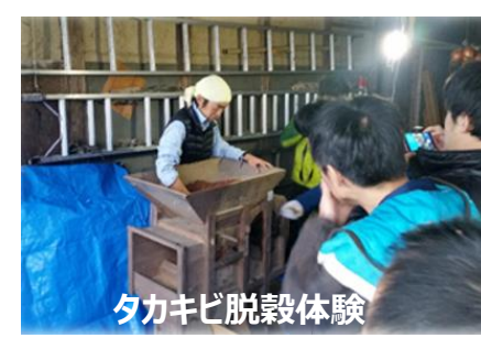
タカキビ脱穀体験