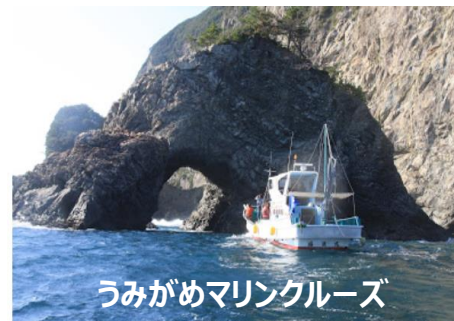
うみがめマリンクルーズ