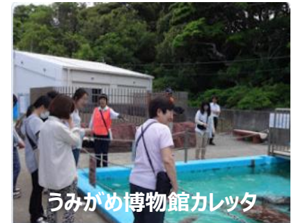
うみがめ博物館カレッタ

https://www.nippon-foundation.or.jp/journal/2020/43293