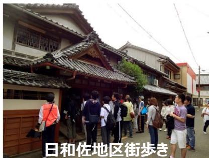
日和佐地区街歩き