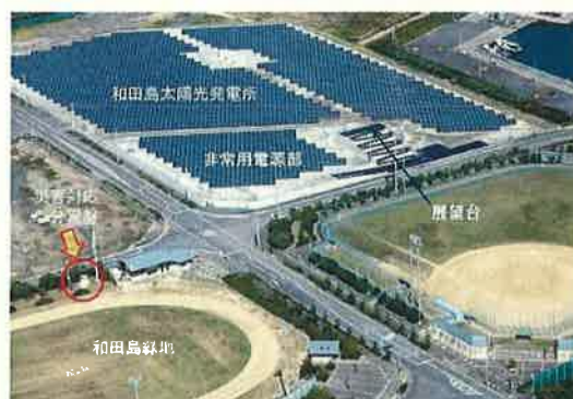
和田島太陽光発電所