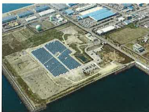
マリンピア沖洲太陽光発電所

また、身近な太陽光発電システムのモデルとして、本庁舎や徳島保健所などにおいても太陽光発電パネル、LED照明、リチウムイオン蓄電池の3点セットでの導入を図っています。