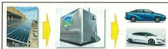
自然エネルギー由来水素ステーションイメージ

「燃料電池自動車（FCV）」を県内に普及させるため、「自然エネルギー由来の水素」を供給する啓発用ステーションを本庁内に整備し、「水素社会啓発体験ゾーン」を設けるほか、様々なイベントでの水素活用体験やFCVの試乗会、ホームページでの広報等、様々な機会を通じて水素エネルギーの有用性や高い環境性能をPRし、水素社会の実現に向けて多様な活用方策を発信します。