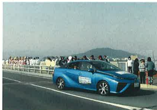
「とくしまマラソン」で先導走行

県公用車に燃料電池自動車を導入するとともに、県内民間団体等の導入を促進し、燃料電池自動車の普及と水素の需要創出を図ります。