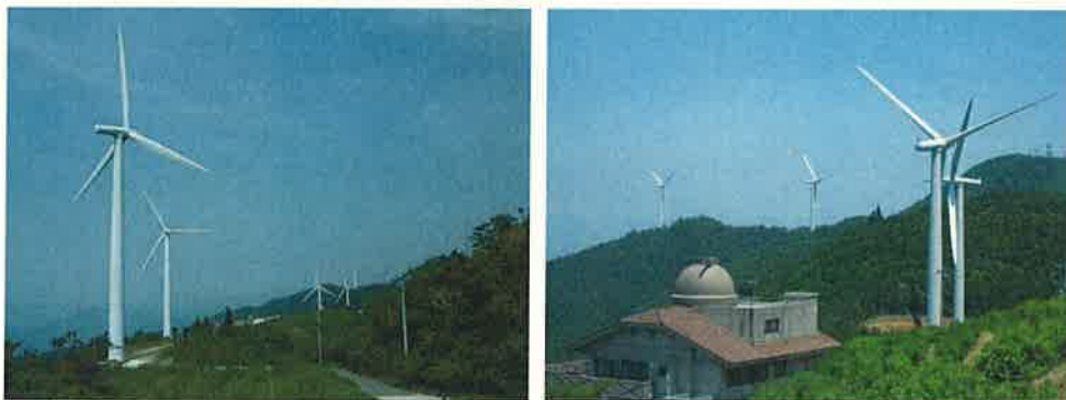
大川原ウインドファーム

太陽光に続く再生可能エネルギーの柱の一つとして、風力発電への期待が高まっており、コンパクトで低騒音な風車といった新たな技術も開発されていることから、さらなる普及拡大を図る必要があります。