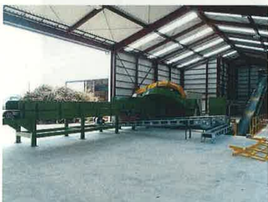
木質バイオマス燃料用加工場

また、平成27年には阿南市において最大約6,200kW、発電所内で使用する電力を差し引いた年間約4,000万kWh（一般家庭約11,000世帯分の年間使用電力量に相当）の電力供給を行う木質バイオマス発電所の整備がスタートし、平成28年4月の営業運転開始を目指しています。