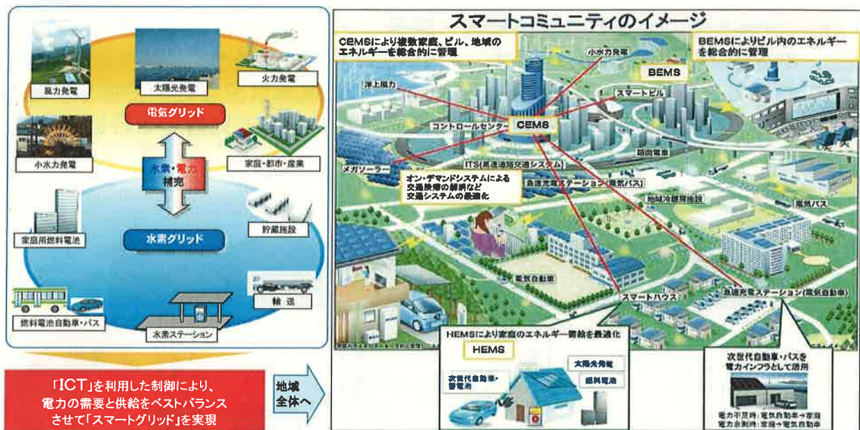
図4-3-2 スマートコミュニティのイメージ