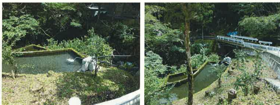
那賀川への小水力発電設置状況

また、県営の夏子ダム（農業用ダム）において、河川維持用水を利用した小水力発電設備を運用するとともに、川口ダムにマイクロ水力発電装置を計画し、設置後は県民の自然エネルギー学習の場として活用することとしています。