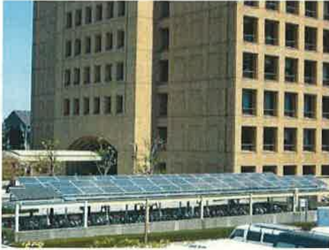
県庁舎太陽光発電パネル