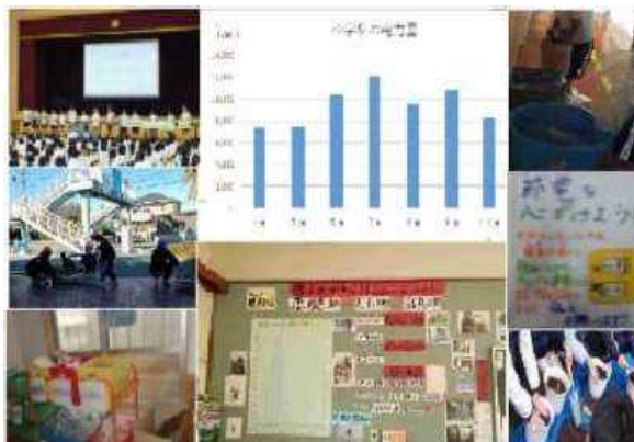
新 学校版環境 I S O の活動の様子

さらには、学校と地域が一体となり、河川の水質調査、清掃などに取り組み、環境保全活動の一役を担っているところもあります。そのほか、県民や事業者の自主的な活動の支援として環境アドバイザーの派遣に取り組みました。