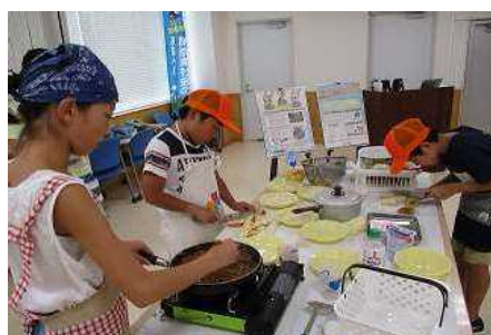
食品ロス削減啓発イベント