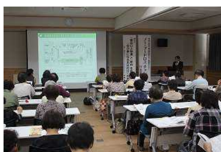
食品ロス削減セミナー

さらに令和元年度には、「食品ロス削減全国大会」を本県で開催し、家庭や飲食店等における食品ロス削減の気運を醸成し、県民運動へと展開しました。