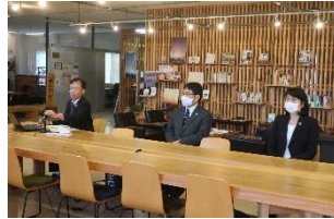
サステナブル経営推進セミナー