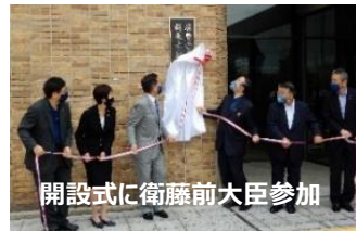
開設式に衛藤前大臣参加