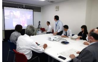
四国4県消費者行政 担当課長会議(WEB)